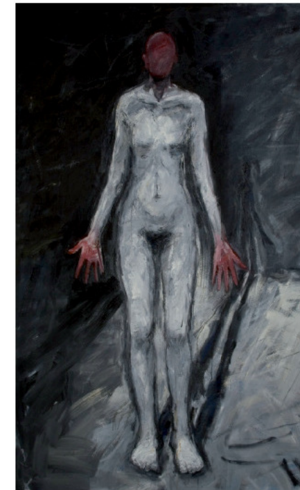
White and Red.